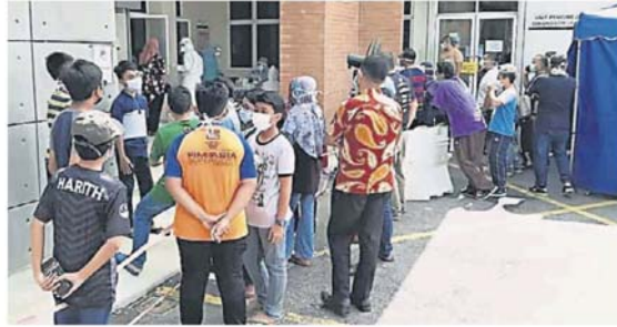
到诊所等待检测。 敦胡申翁镇国中二校相关班级的学生