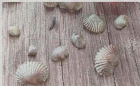
Cockle spats at various stages of growth. Smuggling is one of the causes for dwindling cockle population in Selangor.

Those that were buried too deep within the seabed were either shifted or had excess mud removed