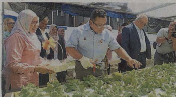
■阿米鲁丁（左二）在沙尤迪（右二）的陪同下巡视菜园。

当天的启用仪式是由雪州大臣拿督斯里阿米鲁丁主持。出席者包括雪州秘书拿督阿敏、八打灵再也副市长哈嘉阿兹林达。（TTE）