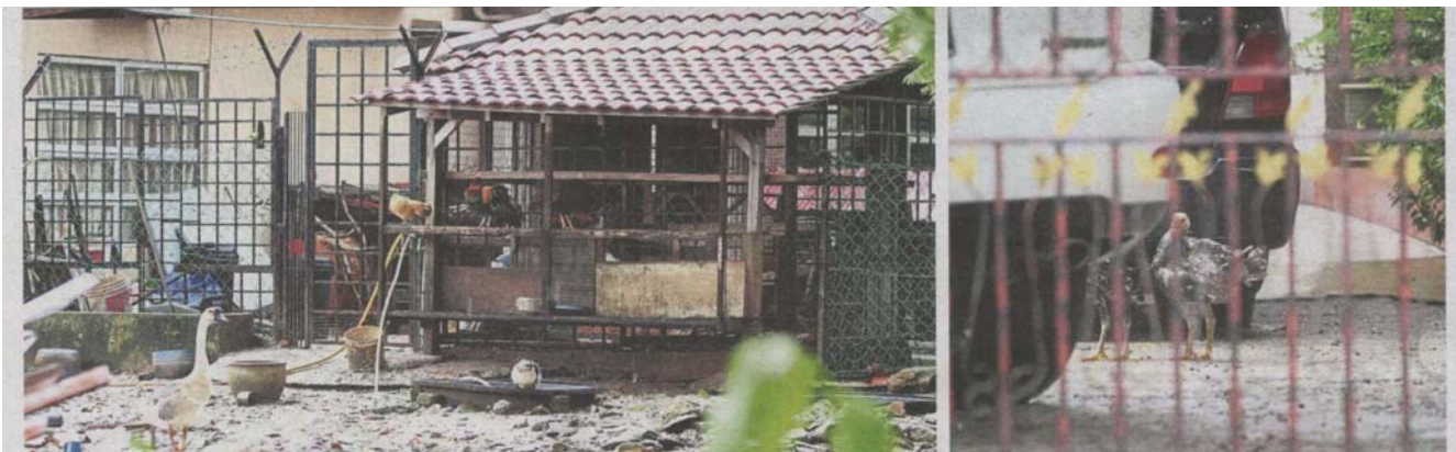
The owner of a house in Taman Sri Andalas has a mini poultry farm with chickens, geese and ducks in the backyard.