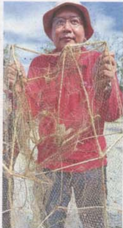
Volunteer divers showing the old fishing nets found near artificial reefs at Bagan Nakhoda Omar.