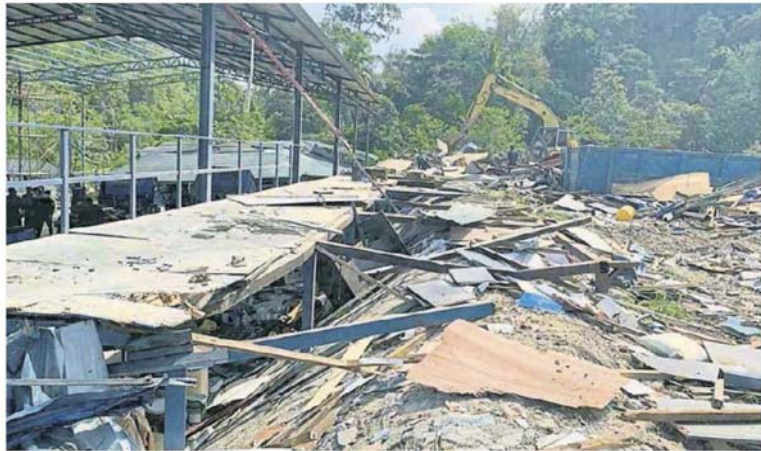
■ 在拆除行动进行后, 非法建筑物也变成了废墟。