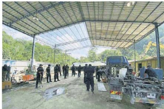
■ 该间修车厂的建筑物设立在农业地段, 建筑物也没有获得市议会批准。

市议会也援引1974年道路、沟渠和建筑物法令第70(1)条文, 拆除该非法建筑物。