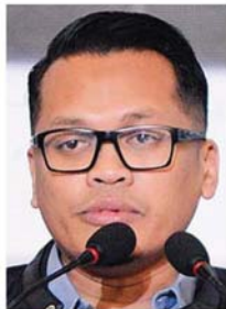
聂纳兹米：公正党开除27名“叛党”党员的党籍。

“其次是雪兰莪,有2352人;砂拉越(1559人)、吉打(1414人)及和柔佛(959人)。”#