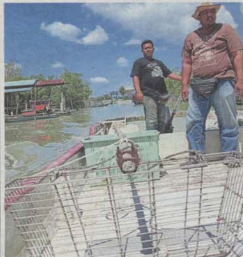
The gaps on cockle scoops (foreground) are made to comply with Fisheries Department directive to ensure harvest of only matured cockles.