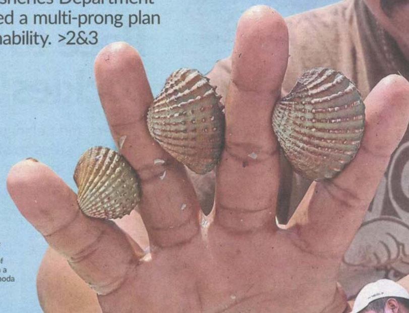
Worrying decline: Cockle farmer Mohd Noh Ikanan showing the varying sizes of the mollusc harvested from a shared lot near Bagan Nakhoda Omar in Sabak Bernam.

Pollution, smuggling and overharvesting have decimated cockle population in Selangor. To turn the tide around, farmers have set a daily harvest limit and the Fisheries Department has initiated a multi-prong plan for sustainability. >2&3