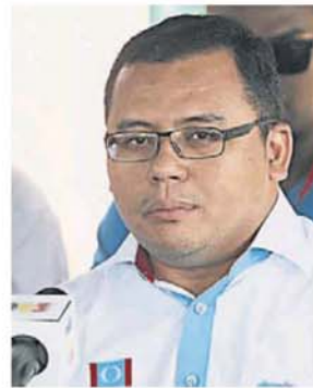
阿米鲁丁料受公正党领导层施压，清除阿兹敏派系的官职。

消息说，上述 4 人中预计至少 2 人会被刷下，避免阿兹敏派系继续掌控资源，作为下届大选的跳巢后盾。